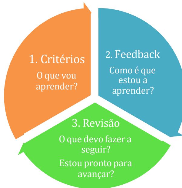
Figura 3- síntese Avaliação Pedagógica

A título de conclusão, se se combinarem os três processos-chave atrás referidos – feed up , feedback e feed forward - e os diferentes agentes implicados (professores, aluno e pares), a avaliação pedagógica poderia ser representada pelo seguinte esquema: