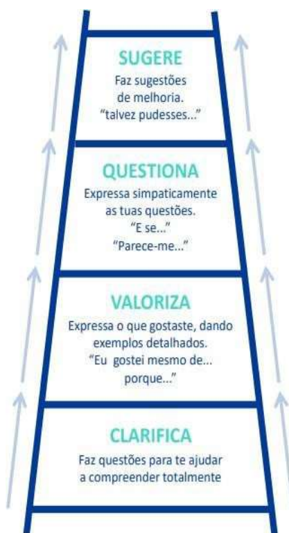
Figura 2- escada do feedback