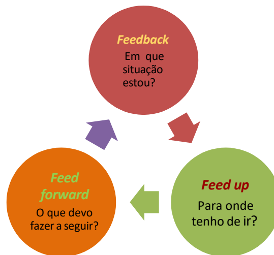
Figura 1- processo de feedback

A componente fundamental da avaliação pedagógica é o feedback.